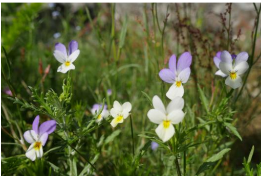
Vid Ångbåtsbryggan växer violer och andra fina sommarblommor. Håll utkik efter den gula stjärnformade laven fetknoppen som växer på stenklipporna. Här finns också spår av "hällristningar" eller vattennivåmarkeringar.