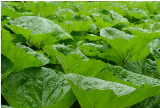
Pestskräp användes förr i tiden av munkarna som botemedel mot pest. De stora bladen är de största som finns i svensk flora.