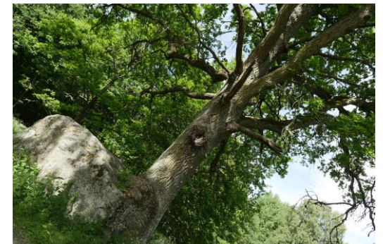
Sten och ek som "vuxit" samman.