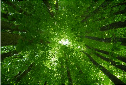
Apostlaringen finns i hörnet av trädgården.