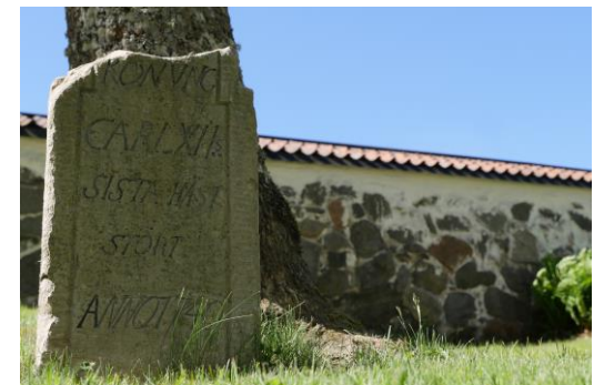
Karl XII:s häst Brandklipparen sägs ha sprungit i ren skräck ut från stallbyggnaden, rakt in i muren och dött där gravstenen står rest.