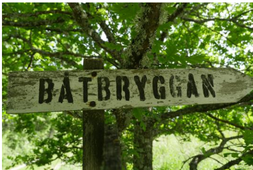
Slottsrundan är drygt två kilometer lång och tar dig ned till den gamla Ångbåtsbryggan.